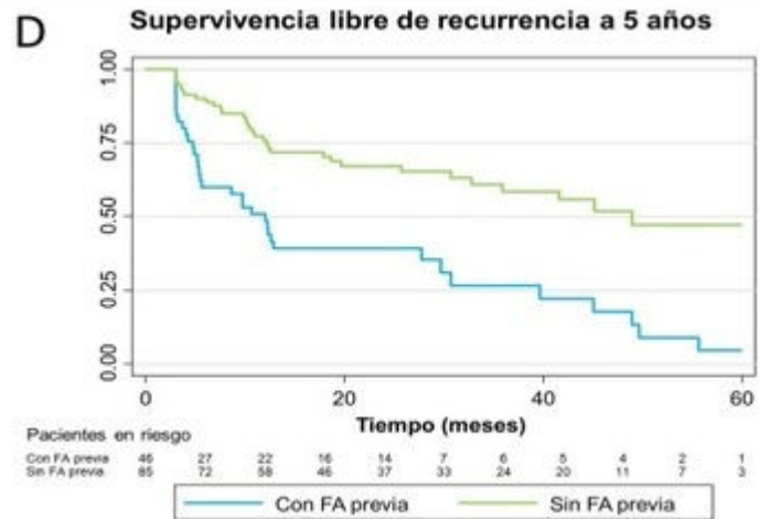
Curvas de Kaplan-Meier para la supervivencia libre de recurrencias al año y a los 5 años.

Conclusiones: El AVVPP concomitante durante la ablación de FLA no mejoró la supervivencia libre de recurrencias arrítmicas a medio ni largo plazo, independientemente del antecedente de FA.