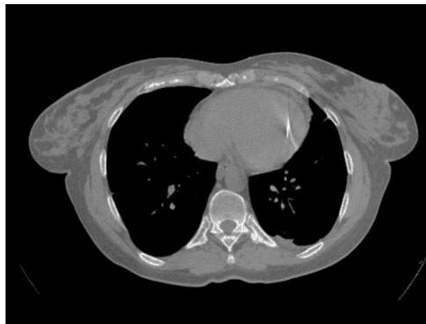
Fig. 1. Imagen tomográfica de la aguja intracardiaca.

Las lesiones cardíacas secundarias a la introducción en el precordio de agujas o alfileres para autoagredirse han sido pocas veces descritas en la bibliografía médica. Esta conducta mutilante se ha observado en pacientes con esquizofrenia, depresión o retraso mental, y como en el caso aquí presentado, el abuso de alcohol o drogas podría aumentar la probabilidad de este comportamiento. En los trabajos publicados, las agujas fueron encontradas libres en la cavidad pe-