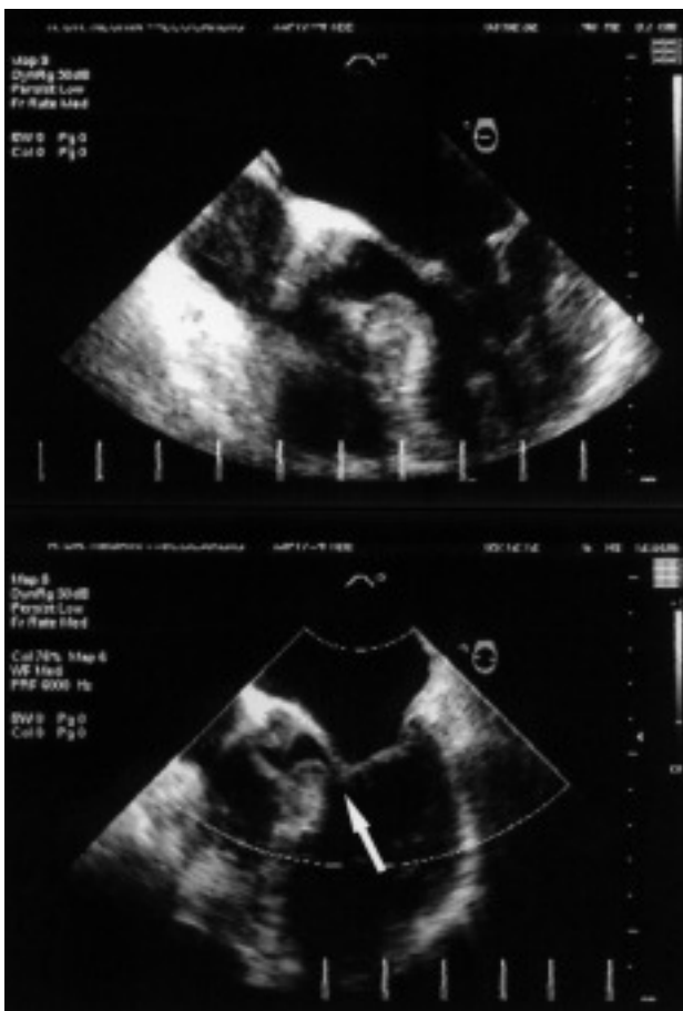
Fig. 1. Imagen de ecocardiografía transefágica, diástole (imagen superior) y sístole (imagen inferior), en la que se puede apreciar la hipertrofia del septo basal y el desplazamiento de la valva anterior de la válvula mitral que obstruye el TSVI (flecha).

cardiogénico, como los fármacos inotrópicos (dopamina, adrenalina, dobutamina) o el balón de contrapulsación intraaórtico, está contraindicado, por lo cual debe orientarse hacia el uso de fármacos que disminuyan el gradiente, como los bloqueadores beta, los agonistas alfa puros, la metoxamina o la fenilefrina, evitando la depleción de volumen o el uso de vasodilatadores 4 .