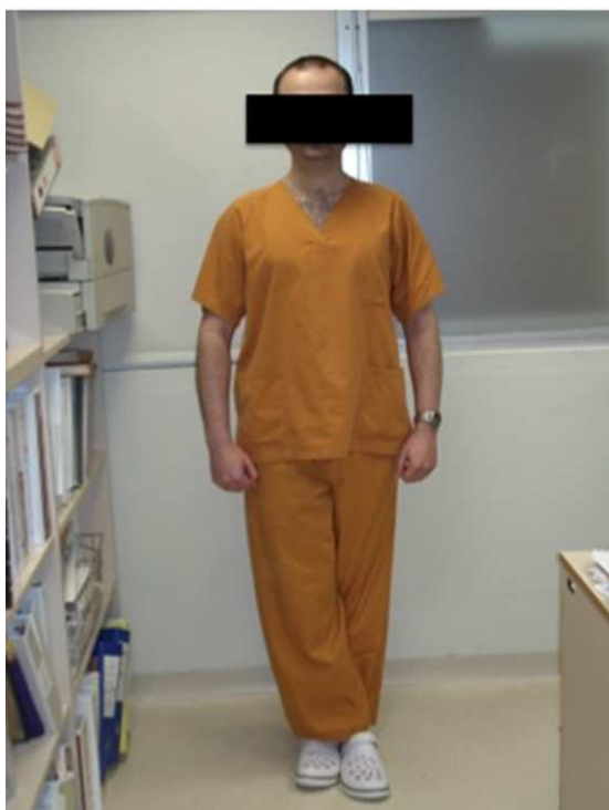
Figura 3. Maniobras de contrapresión: dos tipos de maniobras que han mostrado su efectividad en la prevención del síncope reflejo. Arriba: fuerza centrífuga con las dos extremidades superiores. Abajo: contracción de los cuádriceps. Se debe instruir al paciente en la realización de ambas maniobras e indicarle que las realice alternándolas o en función de su preferencia.

mezcla de pacientes con síncope claramente reflejo y pacientes con hipotensión ortostática; por otro lado, este es un fármaco que en España tiene escasa disponibilidad, no está subvencionado por el sistema público de salud y además es caro.