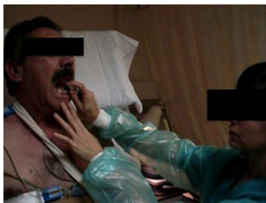
Figura 2. Prueba en tabla basculante. El paciente está en decúbito encima de una camilla y se inclina hasta los 70° respecto al plano horizontal, con los pies apoyados en una tabla. Se monitoriza continuamente la presión arterial y el electrocardiograma. Se fija al paciente a la camilla para evitar que caiga si se presenta un episodio sincopal. Tras 20 min, si no ha habido respuesta sincopal, se administra una dosis de nitroglicerina sublingual en aerosol.

en ellas, con la consiguiente disminución de la volemia central, por lo que se puede desencadenar con mayor facilidad una respuesta refleja en pacientes susceptibles.