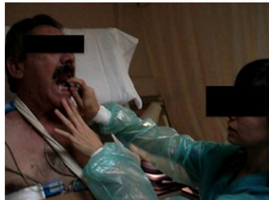
Figura 2. Prueba en tabla basculante. El paciente está en decúbito encima de una camilla y se inclina hasta los 70° respecto al plano horizontal, con los pies apoyados en una tabla. Se monitoriza continuamente la presión arterial y el electrocardiograma. Se fija al paciente a la camilla para evitar que caiga si se presenta un episodio sincopal. Tras 20 min, si no ha habido respuesta sincopal, se administra una dosis de nitroglicerina sublingual en aerosol.

en ellas, con la consiguiente disminución de la volemia central, por lo que se puede desencadenar con mayor facilidad una respuesta refleja en pacientes susceptibles.