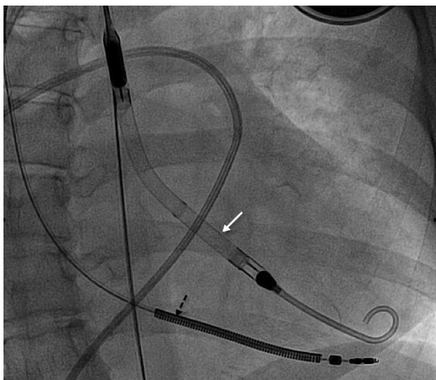
Figura. Escopia durante el implante del Impella CP® (flecha blanca) en la que se aprecia el cable del desfibrilador automático implantable (flecha negra).

«corriente de motor alta». La paciente presentaba de nuevo deterioro hemodinámico, por lo que se retiró el dispositivo disfuncionante y se implantó uno nuevo. Tras 4 días con este segundo dispositivo, la paciente presentó hemianopsia homónima izquierda por hemorragia occipital derecha que requirió drenaje quirúrgico urgente. Se decidió suspender la anticoagulación, y por ello se retiró la AVM manteniendo soporte vasoactivo a dosis altas. Tras 2 semanas de correcta evolución neurológica y ausencia de hemorragia, y ante el deterioro hemodinámico progresivo, se implantó un balón de contrapulsación intraaórtico, sin anticoagulación, y se incluyó a la paciente en urgencia de trasplante cardíaco, que se realizó con éxito a las 48 h. Diez meses después del trasplante cardíaco, presentaba mínimas secuelas neurológicas que no le impedían realizar una vida normal.