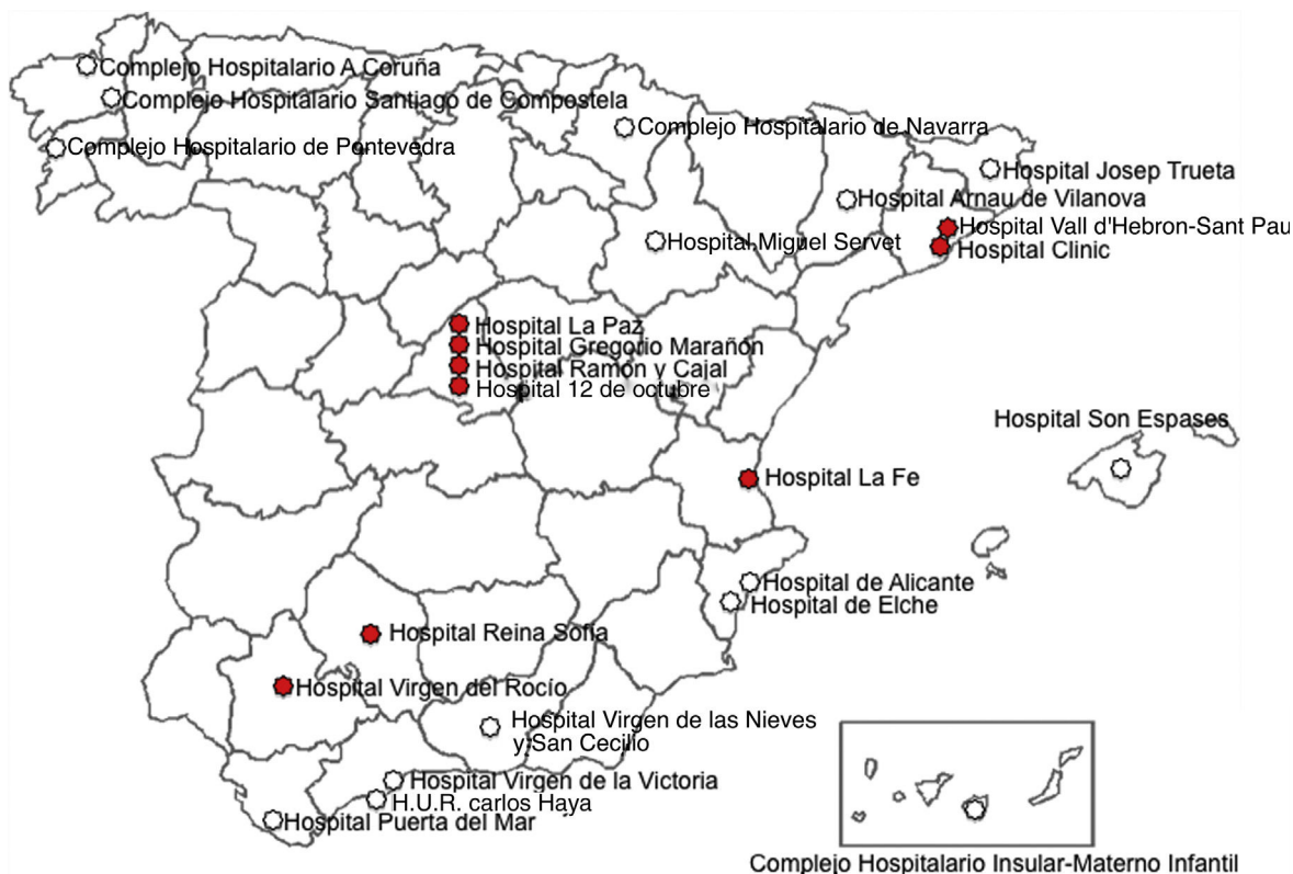
Figura 1. Distribución de los centros con actividad específica en cardiopatías congénitas del adulto en España. Marcados como círculos rellenos, los centros de referencia nacional (CSUR [centros, servicios y unidades de referencia]).