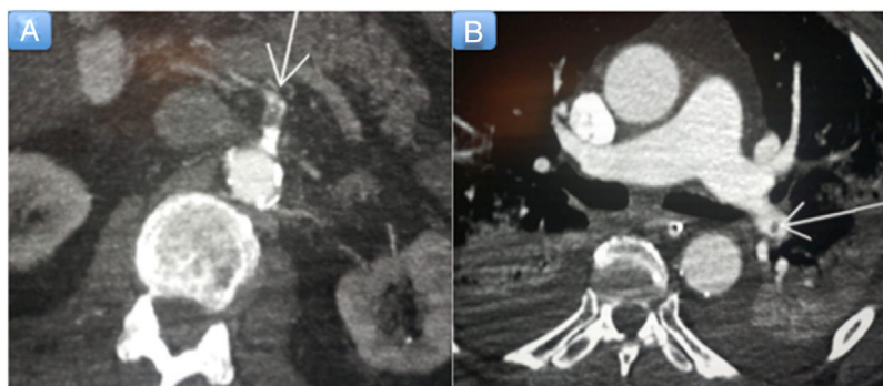
Figura 2. A: tomografía computarizada abdominal; se observa un defecto de repleción en la arteria mesentérica superior, compatible con trombosis arterial (flecha). B: tomografía computarizada de tórax, con hallazgos compatibles con tromboembolia pulmonar (flecha).

hasta una dosis de 0,44 mg/kg/min. Se realizó un cateterismo cardiaco urgente (figura 1C,D), en el que se observó enfermedad coronaria de 3 vasos con oclusión trombótica aguda de la coronaria derecha, que precisó angioplastia y el implante de 2 stents farmacoactivos, con migración de material trombótico hacia la descendente posterior.