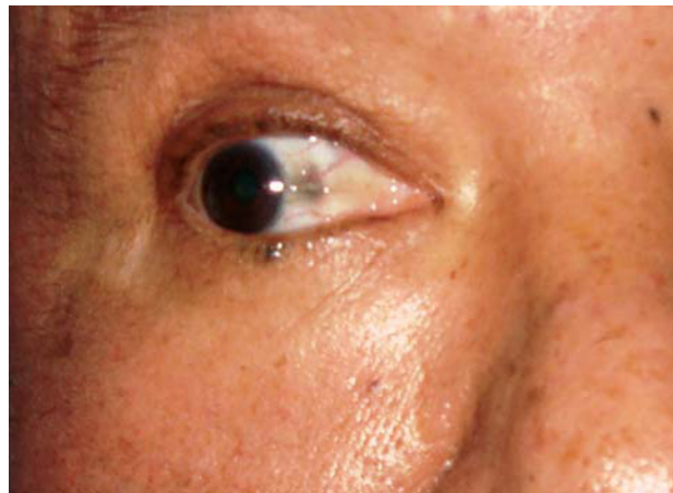
Fig. 1. Coloración negruzca interna de la aorta y pigmentación escleral de ojo derecho.