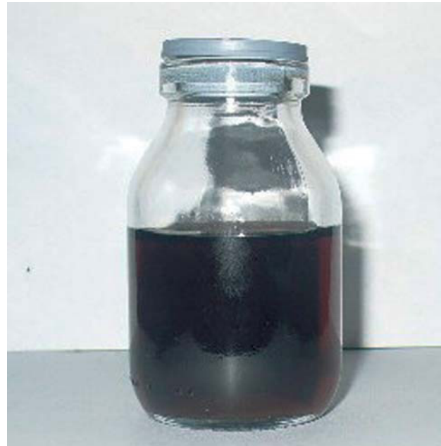
Fig. 2. Orina del paciente que, tras 24 h de exposición al ambiente, cambió de color.

de las válvulas cardíacas, la laringe, las membranas timpánicas y la piel; además, en algunos pacientes se desarrollan cálculos renales o prostáticos 1-4 .